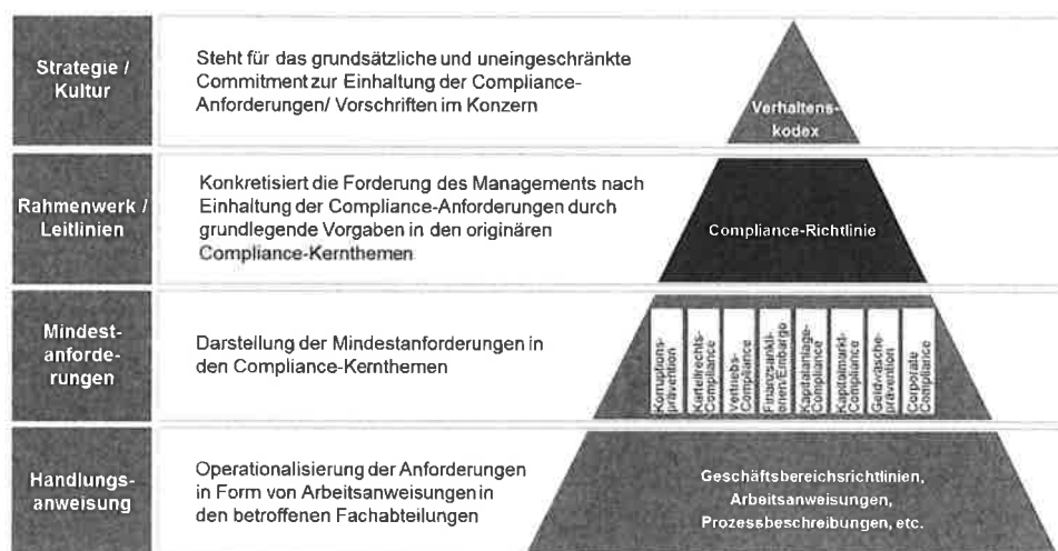
Regelungsstruktur und Compliance-Kernthemen

Diese Compliance-Kernthemen bilden das Compliance-Programm, das risikobasiert umgesetzt wird: