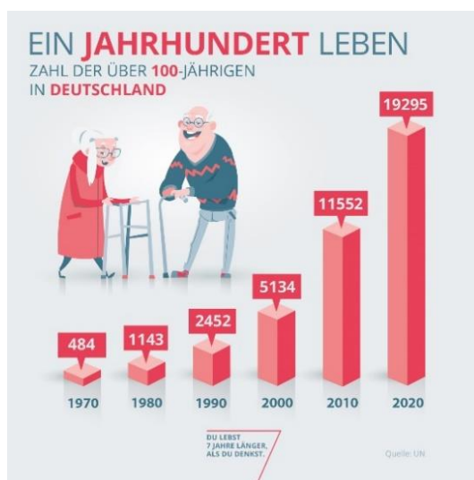
Abbildung 1 Anzahl der über 100-Jährigen in Deutschland im Zeitverlauf 14

Es ist davon auszugehen, dass es für Menschen sehr belastend ist, wenn im Alter der gewünschte Lebensstandard stark eingeschränkt werden muss, weil das selbst angesparte Geld aufgebraucht ist und die gesetzliche Rente nur noch einen deutlich niedrigeren Lebensstandard erlaubt. Die Chance, so alt zu werden, dass sich dieses Risiko materialisiert, steigt immer mehr an, wie man beispielsweise an der stark steigenden Zahl von über 100-jährigen Menschen in Deutschland ablesen kann (vgl. Abbildung 1).